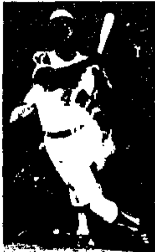
Hank Aaron hits number 755

Aaron, Henry Louis "Hank" (1934- ). American baseball player. Aaron is major league baseball's all-time home run leader, with a career total of 755. He broke the record of 714, previously held by Babe Ruth, in April 1974, after a year of building pressure and anticipation. He began his career in the Negro Leagues, playing two seasons for the Indianapolis Clowns.